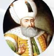
I. SÜLEYMAN KANUNİ SULTAN SÜLEYMAN