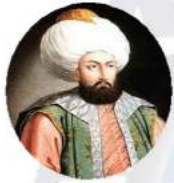
I. MEHMET (ÇELEBİ MEHMET)

II. ABDÜLHAMİT; Onun döneminde değişim rüzgarları esmeye devam etmiş şehzadeligi döneminde piyano dersleri almıştır. Modern bahçe sanatı ile ilgilenmiştir. Sedef ve fildişi kakma, oyma ve süsleme sanatı yapmıştır. Ayrıca usta bir marangozdur.