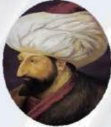
II. MEHMET (FATİH SULTAN MEHMET)