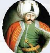
YAVUZ SULTAN SELİM